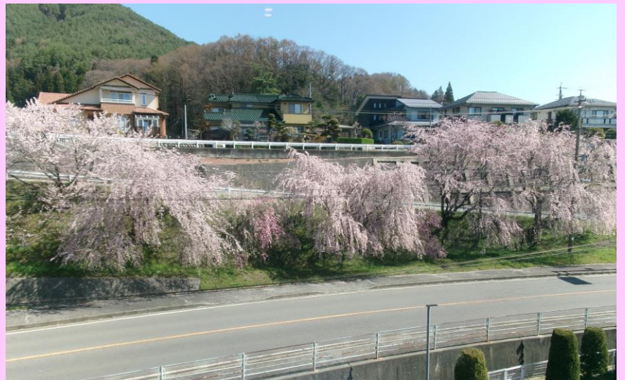
東病棟から見えるしだれ桜。入院中の患者さんもお花見を楽しみます。